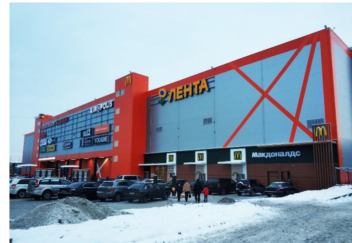
ТРК Сибус, г. Выборг 21.12.2018