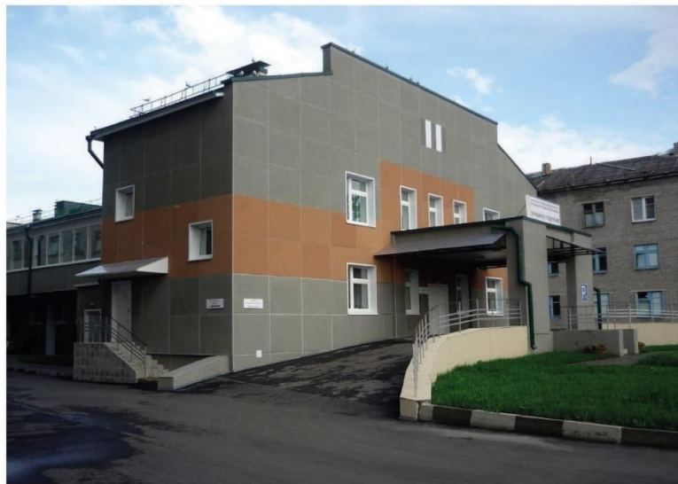
Приемное отделение Псковской городской больницы