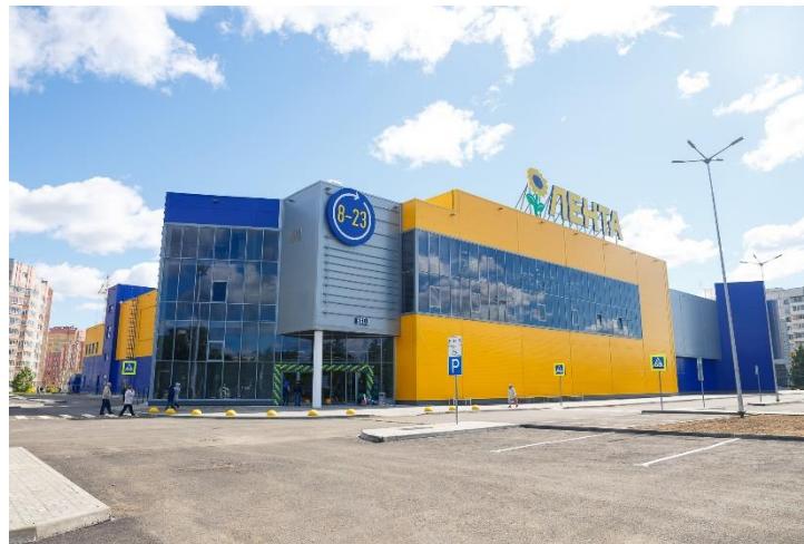
ТЦ «Лента», г. Ярославль 09.06.2018