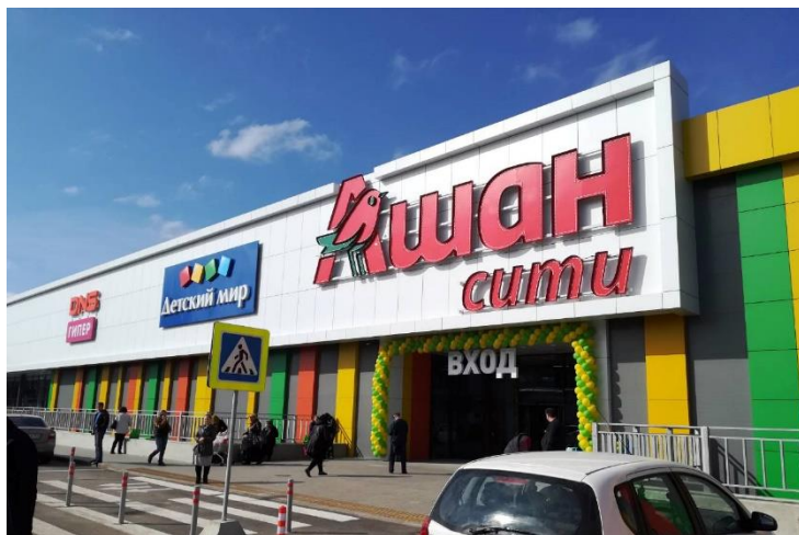
ТЦ «Сказка», г. Краснодар 21.03.2018