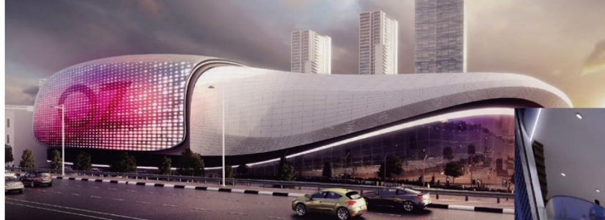
ТРЦ OZ Fashion Mall, Краснодар

Масштабные проекты бюро реализованы во многих странах Европы, Азии и на Ближнем Востоке. Опыт проектирования компании составляет более 50 лет. За это время архитекторы Dyer спроектировали в том числе 29 крупных ТРЦ.