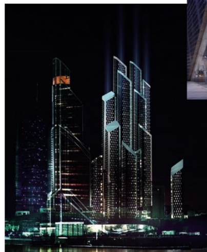
Хрустальные башни, Москва