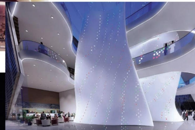
Торгово-офисный центр, Будапешт