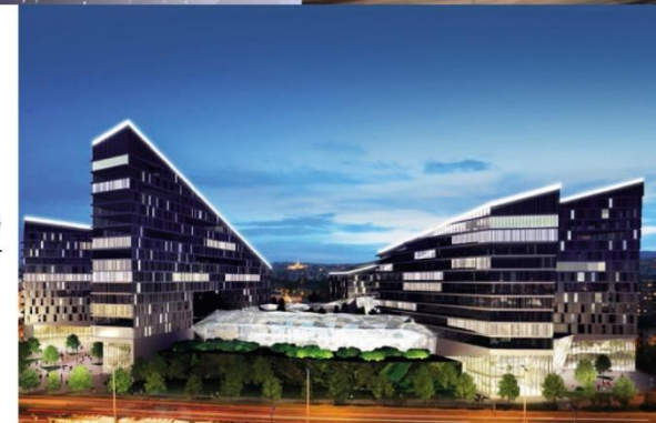
Торгово-офисный центр, Будапешт